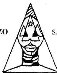
Los Siete Valores